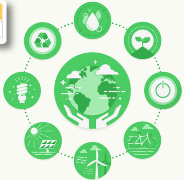
REF Graphic: "Designed by macrovector / Freepik"

ผู้เข้าอบรมต้องมีเวลาเรียนไม่ต่ำกว่า 80% จึงจะได้รับวุฒิบัตร จากสำนักงานพัฒนาวิทยาศาสตร์และเทคโนโลยีแห่งชาติ (สวทช.)